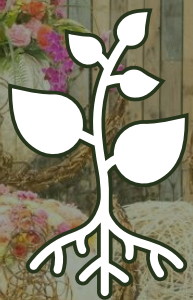
Bloemen & planten