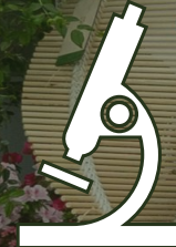
Onderzoek & ontwikkeling