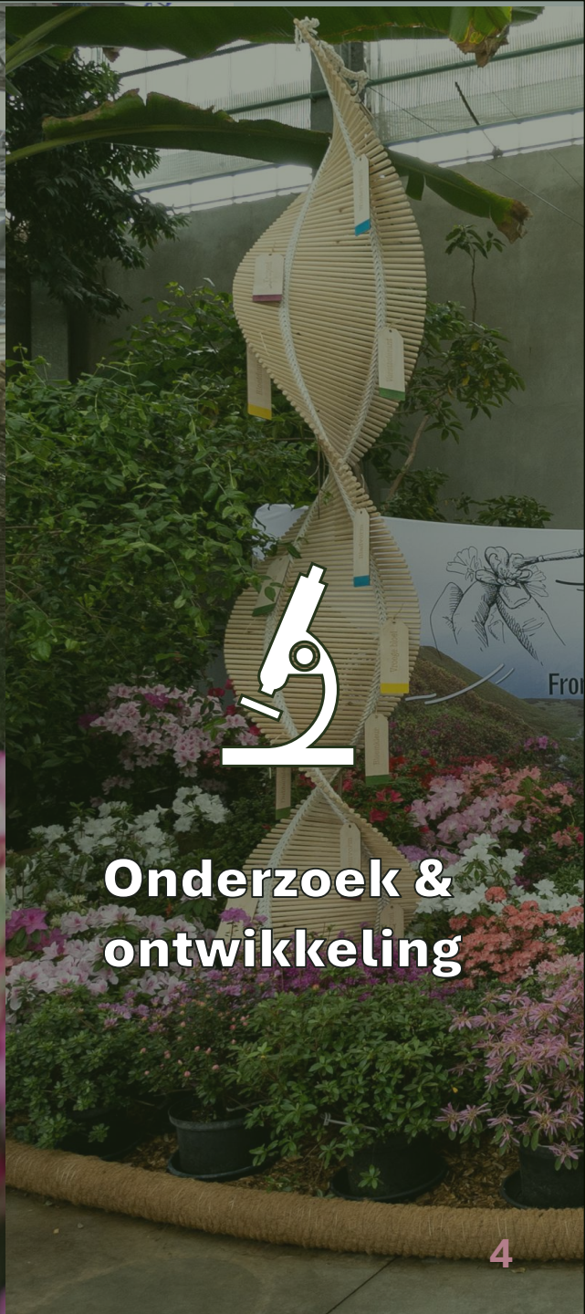
Onderzoek & ontwikkeling