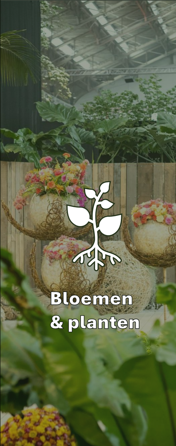
Bloemen & planten